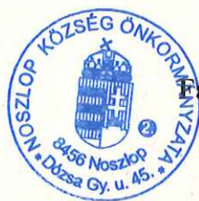
Farkasné Szolnoki Brigitta polgármester